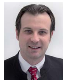
Autor: Dipl.-Ing. Robert Diosi, Produktmanager Varan-Bus, Sigmatek GmbH & Co KG

Der gesamte Produktionsprozess kann ohne zusätzliche Sicherheitseinrichtungen in ein Firmennetzwerk eingebunden werden. Ein unautorisiertes Zugriff aus dem Firmennetzwerk kann die Produktion unter keinen Umständen zum Stillstand bringen. Die Nachrichten aus der Office-Welt werden in einem Varan-Netzwerk in kleine Pakete zerteilt und durch das Varan-Netzwerk getunnelt, ohne den Inhalt zu interpretieren. Zusätzliche Sicherheitseinrichtungen wie Firewalls sind nicht erforderlich. ■