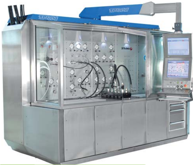
Bild 2: Der Prüfstand für lineare Hydraulikkomponenten und Servoventile nutzt die Varan-Technologie.

Schuller, Entwicklungsleiter bei Test-Fuchs. Dadurch sei eine große Modularität und Effizienz gegeben. Jedes Grundmodul besitzt eine eigene Intelligenz. Das betrifft die Hydraulikversorgung, die Messstationen für rotative und jene für die Prüfung nicht-rotierender Komponenten. Der dezentrale Aufbau der Messeinheiten erleichtert die Programmierung. Die gesamte Anlage ist einfach skalierbar; weitere Optionen lassen sich auch im Nachhinein hinzufügen. Zudem wird erreicht, dass für einzelne Module die gesamte Rechenleistung der SPS zur Verfügung steht.