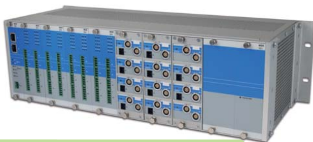
Bild 3: Das modulare MSR Messsystem mit Varan von Sigmatek ist das Herzstück der Messwerterfassung der Test-Fuchs-Prüfstände.

Durch die Hot-Plug-Fähigkeit von Varan können ganze Maschinen bei vollem Echtzeitbetrieb der Anlage eingebunden werden. Die neu eingebundene Komponente wird automatisch identifiziert und bei Gültigkeit in die Produktions-