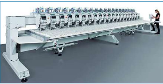
Mit der Adaption der erprobten „Schiffli“-Technik in Kleinstickmaschinen ist es Lässer gelungen, die Stickqualität zu steigern und mehr Effektmöglichkeiten zu erzielen.

rend sein würde. Zudem galt es, eine zentrale Steuerungslösung zu realisieren. Eine einzige CPU sollte alle Aufgaben der Steuerung, Antriebstechnik und Visualisierung mit hoher Performance umsetzen, um einen attraktiven Verkaufspreis der Maschinen erreichen zu können. Fündig wurde man bei Sigmatek in Lamprechtshausen bei Salzburg: Die Hardware auf C-DIAS Basis, das All-in-one Engineering-Tool LASAL sowie der schnelle Echtzeit-Ethernetbus VARAN ▶