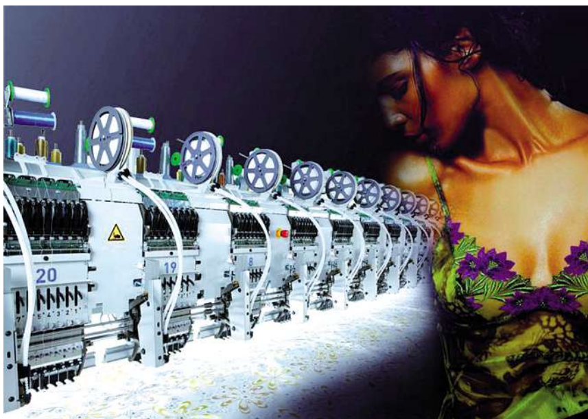
(R)Evolution: Mit dem Modell LSH der Schweizer Lässer AG hält die viele Vorteile bietende Schiffchentechnik Einzug in den Bereich der Kleinstickmaschinen.

Durchgängiges Konzept für Steuerung, Antriebstechnik und Visualisierung