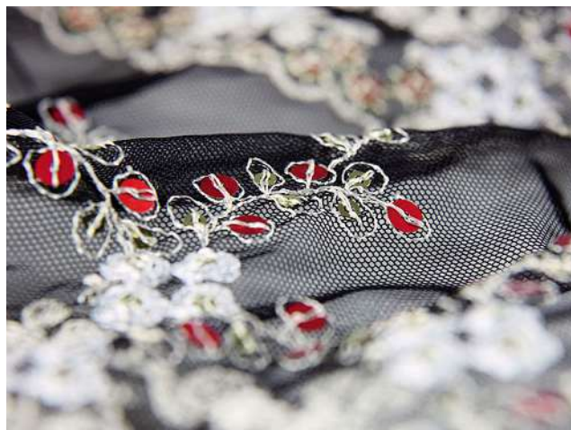
Durch die Schiffchen-Technik, die sich bei den Großstickmaschinen von Lässer zigtausendfach bewährt hat, lassen sich Präzision und Qualität bei Kleinstickmaschinen signifikant steigern.