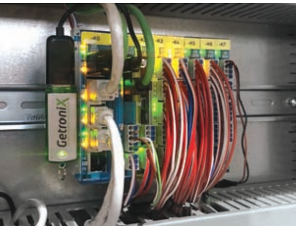
Oben: Als steuerungstechnisches Herzstück der runderneuert Schlagschere fungiert nun ein kompakter »S-Dias«-Modulblock, der sich aus Standard- und Safety-CPU sowie digitalen, analogen sowie sicheren I/O-Modulen zusammensetzt. Ganz links zu sehen der USB-Stick für die von Getronix entwickelte Endlos-Datenaufzeichnungs-Lösung.