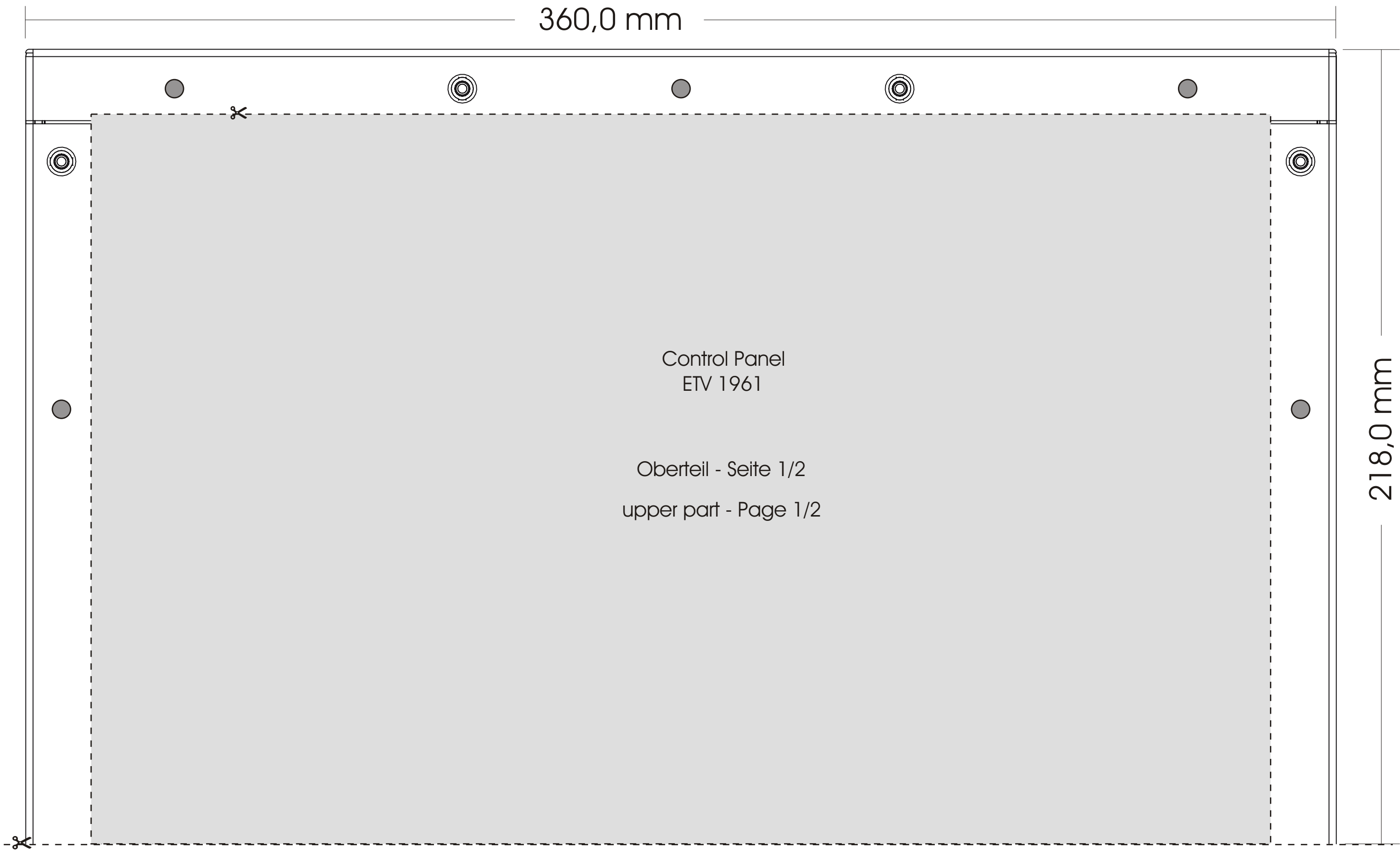
Einbauschablone für ETV 1961 Mounting diagram for ETV 1961

● Bohrungsdurchmesser: 5 mm Hole diameter: 5 mm